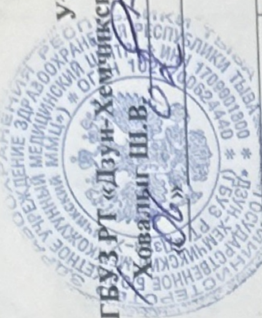
График выездов на III квартал 2026 года

Утверждаю Главный врач ГБУЗ РТ «Дзун-Хемчикский ММЦ» Ховалыг Ш.В. 2026г.